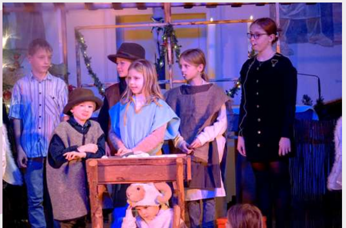
Bild oben: Kinderbibelwoche Bild links: Kirchenbezirkkarte Neuenbürg Bild rechts: Krippenspiel