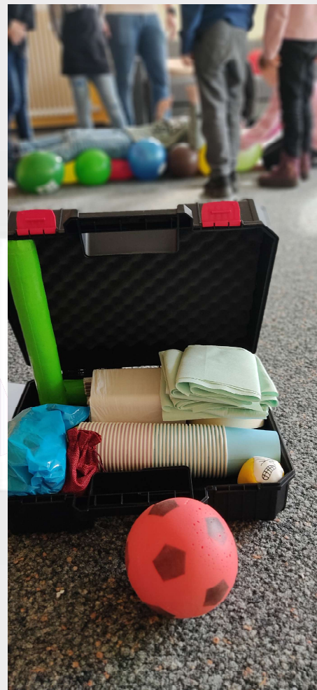
Bild oben: Gottesdienst zur Einschulung Bild links: Karte Kirchenbezirk Neuenbürg Bild rechts: Jungscharkoffer