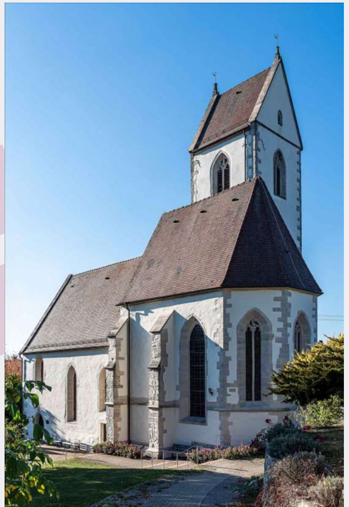
Bild oben: Stadtkirche Rosenfeld Innenansicht mit Engel-Ausstellung Bild links: Pfarrhaus Rosenfeld Bild rechts: Martinskirche Isingen