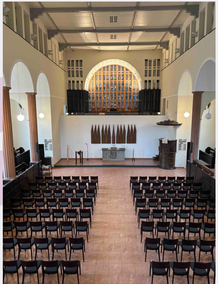
Bild oben: Evangelische Stadtkirche Oberndorf a. N. - Innenansicht nach Westen