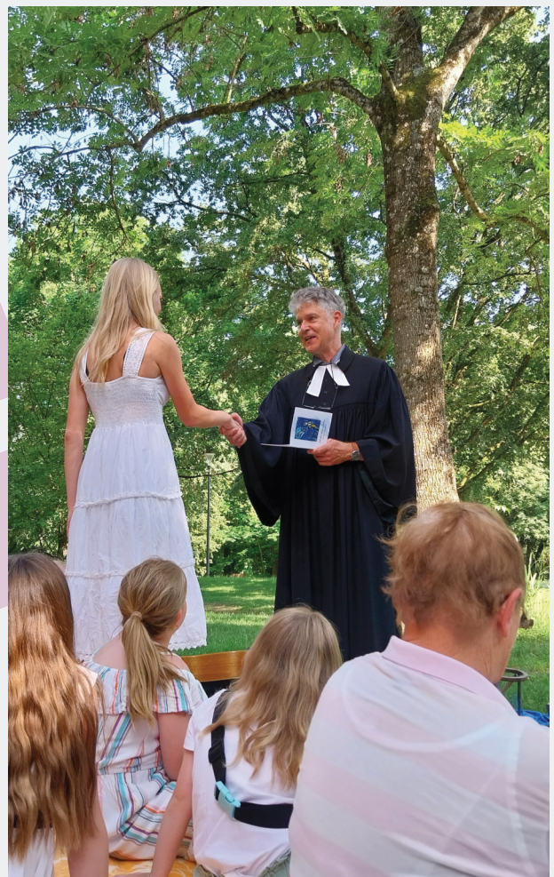
Bild 1: Team in der KG Öhringen Bild 2: Kirchenbezirk Hohenlohe Bild 3: Taufe im Rahmen von Konfi 3 im Öhringer Hofgarten