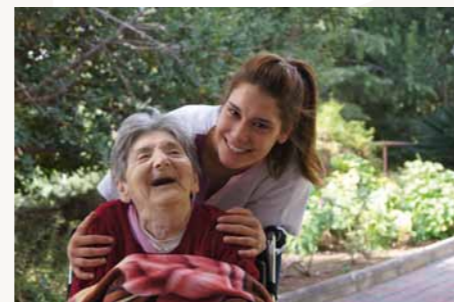
Liebevolle Zuwendung über die Pflege hinaus