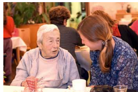
Heimbewohnerin und Mitarbeiterin beim Kaffeetrinken

Auf Wunsch erhalten Sie gerne unseren separaten Hausprospekt und das aktuelle Jahresprogramm.