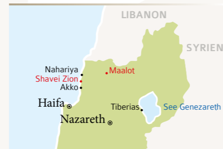
ZEDAKAH-Standorte (rot) in Israels Norden

In unserem Pflegeheim in Maalot werden seit 1984 pflegebedürftige Juden, die den Nationalsozialismus überlebt haben, gepflegt und umsorgt. Dazu stehen 24 begehrte Pflegeplätze zur Verfügung. Das Wort „Elieser“ bedeutet „mein Gott ist Hilfe“. Diese Hilfe sollen die Bewohner durch praktische Nächstenliebe persönlich erfahren.