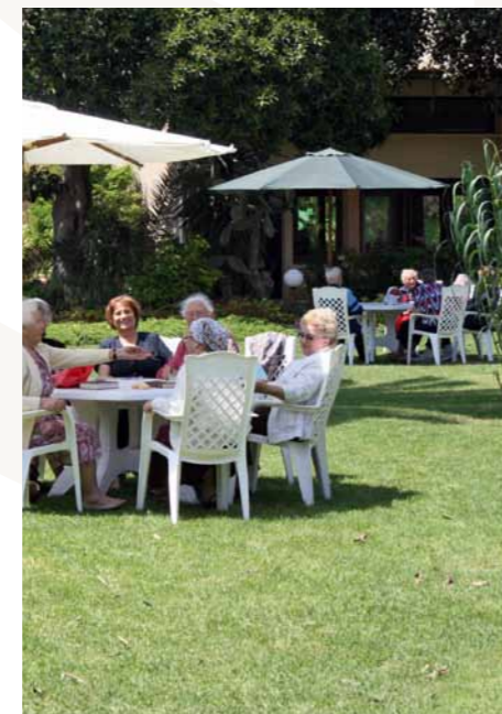
Begegnung unter Holocaustüberlebenden

In unserem Gästehaus bekommen Überlebende des Holocaust seit 1969 die Möglichkeit, einen kostenlosen Urlaub am Mittelmeer zu verbringen. Dazu werden sie in Gruppen von jeweils 42 Personen für zehn Tage eingeladen. Jährlich sind das rund 500 Gäste.