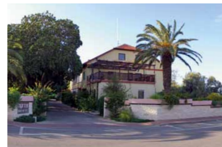
Beth El – Gästehaus in Shavei Zion